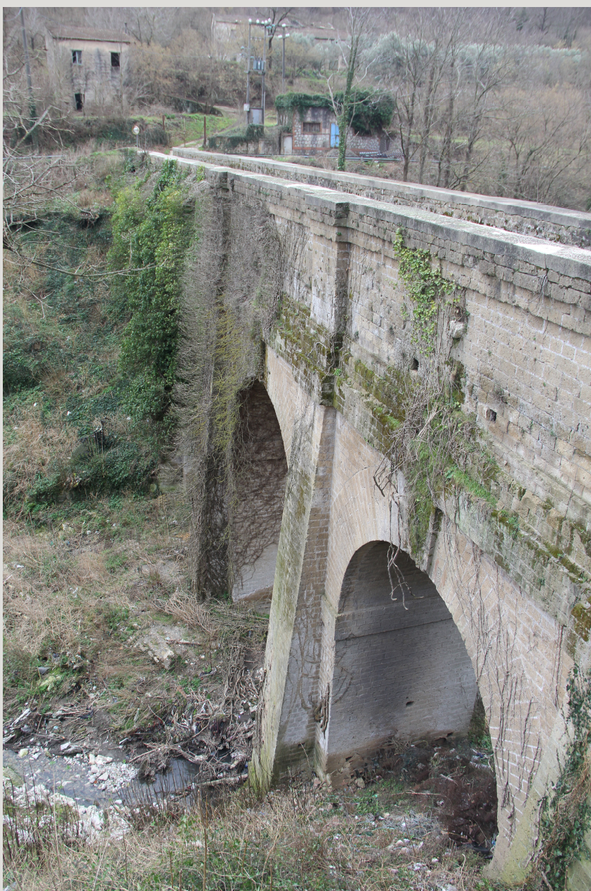
Acquedotto Carolino - Ponte di Durazzano